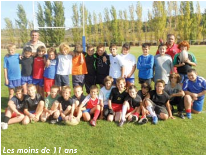
Les moins de 11 ans