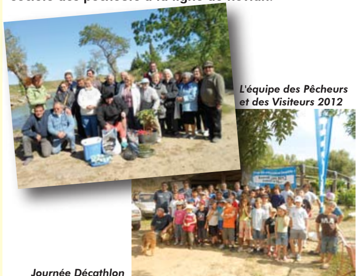
L'équipe des Pêcheurs et des Visiteurs 2012

Pour tout renseignement vous pouvez consulter le site : société des pêcheurs à la ligne de névia.