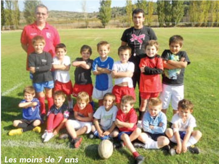
Les moins de 7 ans