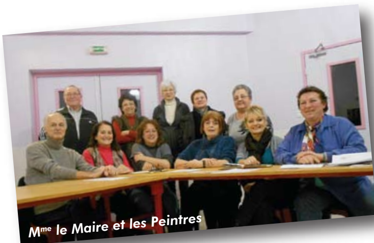
M me le Maire et les Peintres

Chaque année quelques expositions sont organisées. La plus importante est celle de juin à la mairie qui sert à montrer son travail de l'année.