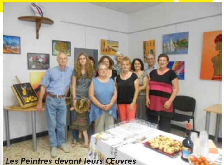
Les Peintres devant leurs Œuvres

L'équipe de l'atelier sera heureuse de vous accueillir et de vous faire découvrir le plaisir de peindre en groupe.