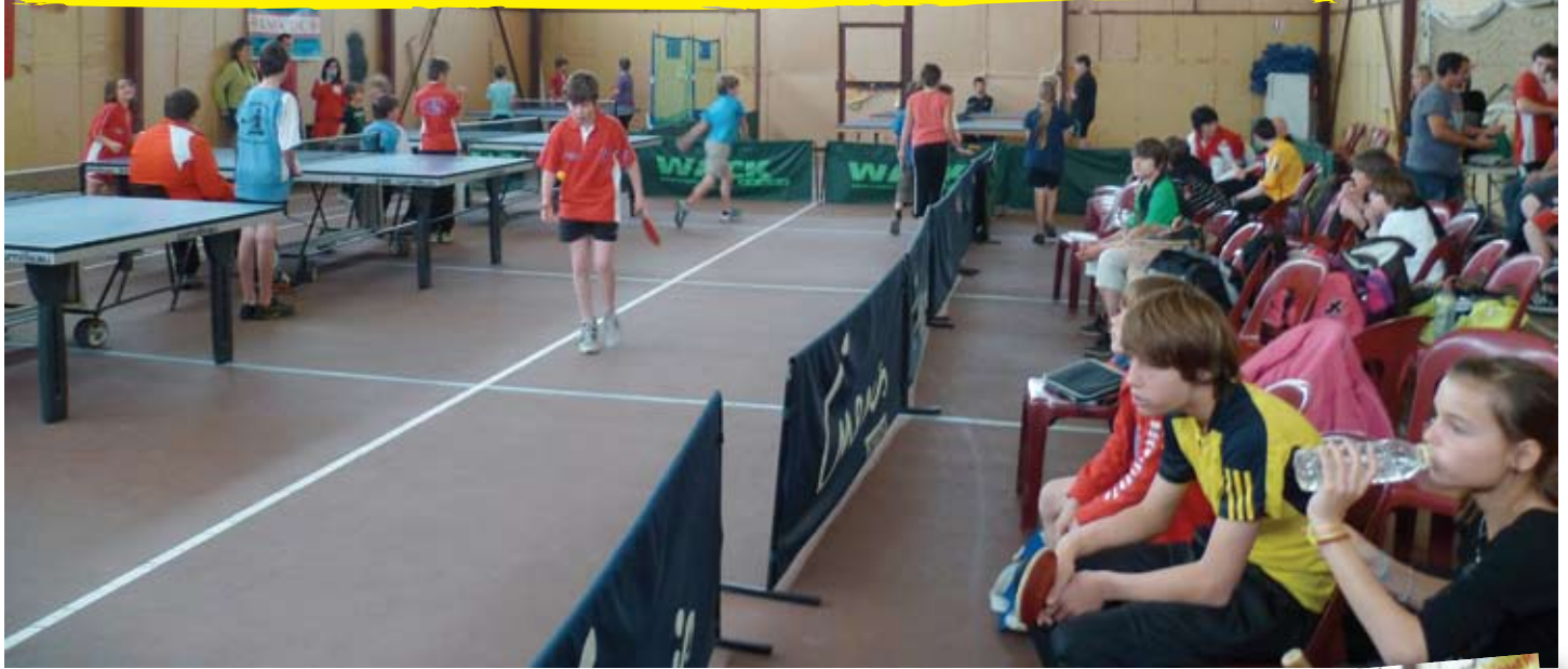
Tournoi du club le 5 mai 2012 (65 participants)

Tél. : 04 68 93 56 48 - Mail : ngtt01@laposte.net Site : http://pagesperso-orange.fr/ngtt01