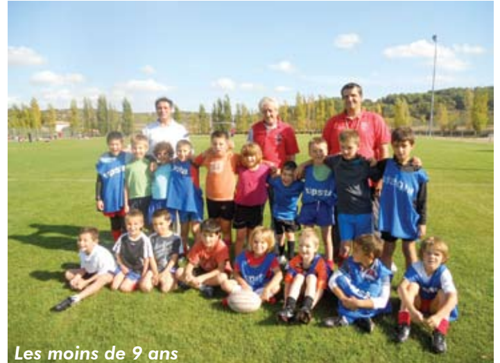
Les moins de 9 ans